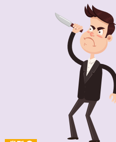
类型 1 伤害或杀害被继承人的人