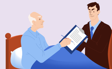
类型 2 强迫、阻挠立遗嘱，或损坏破坏遗嘱的人